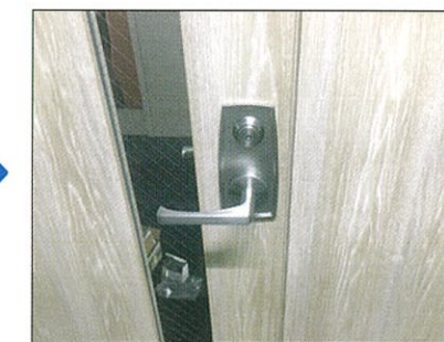
電気錠切欠加工後

入退室管理を導入することで不正侵入の抑止だけでなく、日常的なセキュリティ意識の向上や管理業務の効率化が期待できます。入退室管理の導入をご検討中の方、または「まずは話を聞いてみたい」という方も、導入後の運用やアフターサポートまで含めてご対応いたしますのでぜひお気軽にお問合わせください。