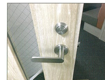
電気錠切欠加工前

既存の扉や現在の運用を 活かしながら、無理なく 入退室管理システムを 導入できます。